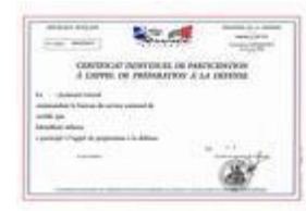
Certificat de participation au JAPD ou Situation militaire