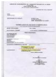
Notification de la CDAPH