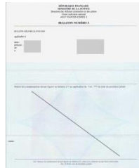
Extrait n°3 de votre casier judiciaire